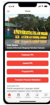
Gambar 1. Menu Beranda Aplikasi SIM-FADA

Pertama, beranda. Pada halaman home atau beranda aplikasi SIM-FADA berisi informasi dasar tentang praktik pengalaman lapangan fakultas dakwah Universitas Islam Negeri kyai Haji Ahmad Siddiq Jember. Di antara beberapa informasi dasar yang sangat penting terkait praktik pengalaman lapangan Fakultas Dakwah ialah pedoman PPL jadwal PPL, proposal PPL dan template presentasi kehadiran selama melaksanakan kegiatan PPL di instansi yang ditempati oleh peserta PPL.