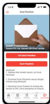
Gambar 5. Menu Surat Penarikan

waktu maka hal tersebut sangat efisien sekali baik efisien secara waktu maupun biaya. Ketika Peserta Praktik Pengalaman (PPL) menginput nama dosen pamong dan kepala instansi lokasi Praktik Pengalaman Lapangan (PPL) maka semua data tersebut langsung integrasi pada database Aplikasi Sistem Informasi Magang Fakultas Dakwah (SIM-FADA). Aplikasi ini bersifat realtime artinya ketika salah satu peserta menginput nama dosen pamong atau kepala instansi maka akan langsung terupdate di database dan peserta yang lain ataupun panitia dapat langsung segera melihat nama dosen pamong dan kepala instansi tersebut.