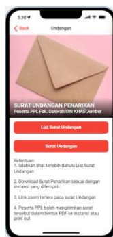
Gambar 8. Menu Surat Undangan

Ke delapan, fitur surat undangan. Surat undangan adalah menu yang disediakan pada aplikasi sistem informasi maka fakultas dakwah untuk didownload serta praktik pengalaman lapangan dan dicetak. Surat undangan tersebut berisi permohonan kepada instansi terkait untuk menghadiri pelepasan peserta.