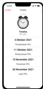
Gambar 6. Menu Timeline

dengan adanya aplikasi ini proses pembuatan surat-menyurat dapat sangat cepat dalam hitungan menit.