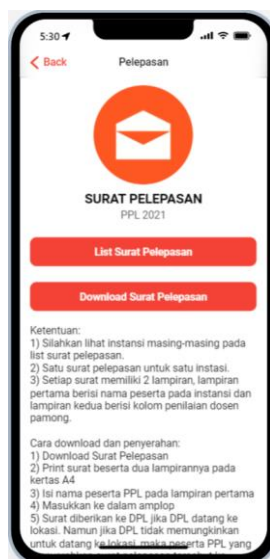
Gambar 7. Menu Surat Pelepasan

Pada tanggal 30 November 2021 adalah ujian Praktik Pengalaman Lapangan (PPL) yang dilakukan secara online. Ujian ini menggunakan zoom meeting dengan fasilitas Breakout rooms yang dibagi menjadi 28 ruangan untuk 28 kelompok praktik pengalaman lapangan.