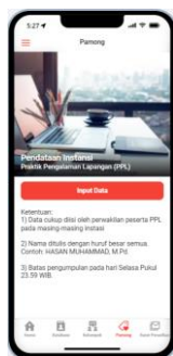
Gambar 4. Menu Dosen Pamong