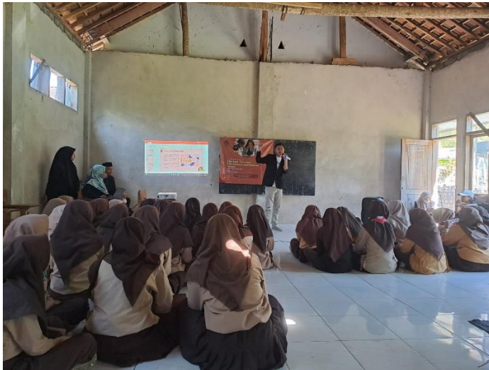
Gambar 4. Kegiatan Sosialisasi