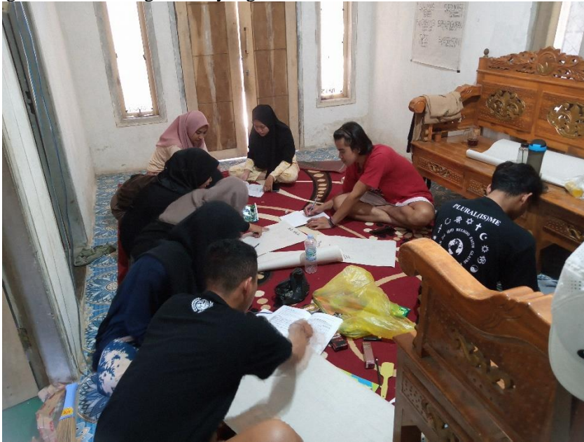
Gambar 1. Proses perencanaan kegiatan sosialisasi di MA Raudhatul Ulum

MA Raudlatul Ulum merupakan salah satu sekolah yang yang berada di desa Ledokombo, Kecamatan Ledokombo, Kabupaten Jember. MA Raudlatul Ulum tersebut berada di bawah naungan yayasan Raudlatul Ulum. Alasan memilih sekolah MA Raudlatul Ulum dikarenakan MA Raudlatul Ulum tersebut menjadi satu-satunya sekolah di jenjang sekolah menengah atas yang ada di desa Ledokombo.