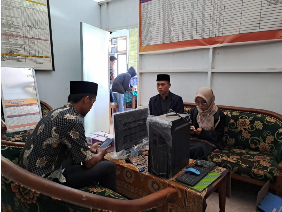
Gambar 2. Konfirmasi ke Kepala Sekolah MA Raudhatul Ulum

Pada tanggal 27 Juli 2022, kami mulai mempersiapkan hal-hal yang akan disampaikan kepada pihak sekolah. Dan terdapat beberapa hal yang perlu disiapkan dan ditanyakan kepada pihak sekolah, seperti waktu dan tempat pelaksanaannya. Kemudian pada hari Kamis 28 Juli 2022, kami mengunjungi sekolah tersebut untuk menemui kepala sekolah MA Raudlatul Ulum untuk mengonfirmasikan tentang sosialisasi yang berjudul pentingnya pendidikan yang akan dilakukan sekolah tersebut.